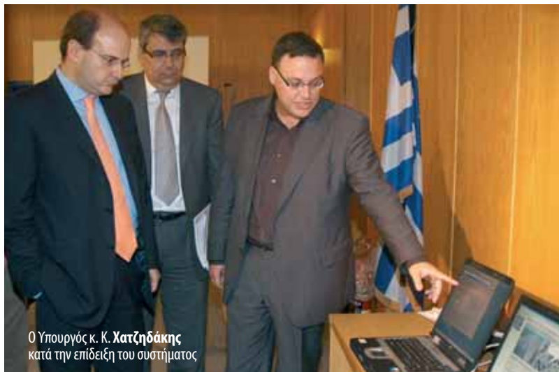
Ο Υπουργός κ. Κ. Χατζηδάκης κατά την επίδειξη του συστήματος

απαιτήσεων θα εποπτεύεται από την Εθνική Επιτροπή Ατομικής Ενέργειας κατά τα πρότυπα ISO, ενώ θα αξιοποιηθεί και η εμπειρία που υπάρχει μέχρι στιγμής από την πιλοτική λειτουργία του συστήματος ΕΡΜΗΣ, που υποστηρίζεται από το Πολυτεχνείο. Το νομοσχέδιο θα κατατεθεί στις αρχές Σεπτεμβρίου και δε θα αλλάξει τα ήδη υπάρχοντα όρια ακτινοβολίας. Ο νόμος που ισχύει στη χώρα μας θεσπίζει όρια ακτινοβολίας κατά 30% πιο αυστηρά από εκείνα που έχει ορίσει η ευρωπαϊκή σύσταση του 1999. Ο σχεδιασμός, η ανάπτυξη και η πειραματική λειτουργία του σχεδίου θα ξεκινήσει στα τέλη του 2008 και θα ολοκληρωθεί το 2010. Το δίκτυο αναμένεται να τεθεί σε πλήρη λειτουργία κατά τα τέλη του 2010 – αρχές 2011. Το κόστος του, σύμφωνα με τους υπολογισμούς που έχουν γίνει από τους τεχνικούς, κυμαίνεται περίπου στα 4 εκατομμύρια ευρώ, με χρηματοδότηση από το ΕΣΠΑ (Δ' ΚΠΣ) και από την Εθνική Επιτροπή Τηλεπικοινωνιών και Ταχυδρομείων.