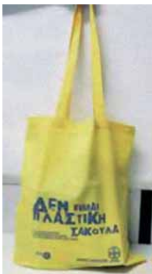
Η πάνινη σακούλα του Δήμου Αθηναίων

Εννέα μεγάλα σουπερμάρκετ υπέγραψαν στις 11 Φεβρουαρίου, συμφωνία-μνημόνιο με τον Δήμαρχο Αθηναίων Νικήτα Κακλαμάνη, για την πιλοτική εφαρμογή ενός προγράμματος σταδιακής αντικατάστασης της πλαστικής σακούλας. Το πρόγραμμα αρχίζει στις 14 Απριλίου, ενώ από 1 Ιουνίου θα αρίσει η πλήρης εφαρμογή του στα όρια του Δήμου Αθηναίων. Σύμφωνα με τι δηλώσεις του κ. Κακλαμάνη, το μέτρο αυτό θα επεκταθεί σταδιακά σε όλη τη χώρα μέσω της Κεντρικής Ένωσης Δήμων-Κοινοτήτων Ελλάδος (ΚΕΔΚΕ). Ήδη πολλές πόλεις από διάφορες περιοχές της χώρας εκδήλωσαν σχετικό ενδιαφέρον.