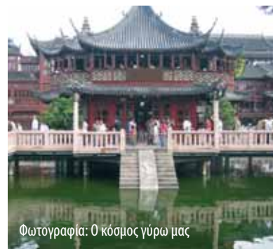
Φωτογραφία: Ο κόσμος γύρω μας

Κυκλοφόρησε το πρώτο βιβλίο για τη σύγχρονη Ελλάδα που εκδόθηκε στην κινεζική γλώσσα, από ένα από τα πιο έγκριτα ερευνητικά ιδρύματα της χώρας, το Ινστιτούτο Ευρωπαϊκών Σπουδών της Κινεζικής Ακαδημίας Κοινωνικών Επιστημών που εκδίδει και την Κινεζική Επιθεώρηση Ευρωπαϊκών Σπουδών. Συγγραφέας του βιβλίου αυτού των 428 σελίδων που προβάλλει ποικίλες πτυχές της σύγχρονης Ελλάδας, είναι η επίκουρη καθηγήτρια και ερευνήτρια του Ινστιτούτου Ευρωπαϊκών Σπουδών Σονγκ Σιαομίν. Την έκδοση προλογίζει ο υπουργός Επικρατείας Θεόδωρος Ρουσόπουλος, ενώ περιέχει μήνυμα του